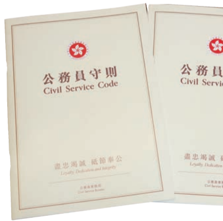
《公務員守則》。公務員事務局供圖