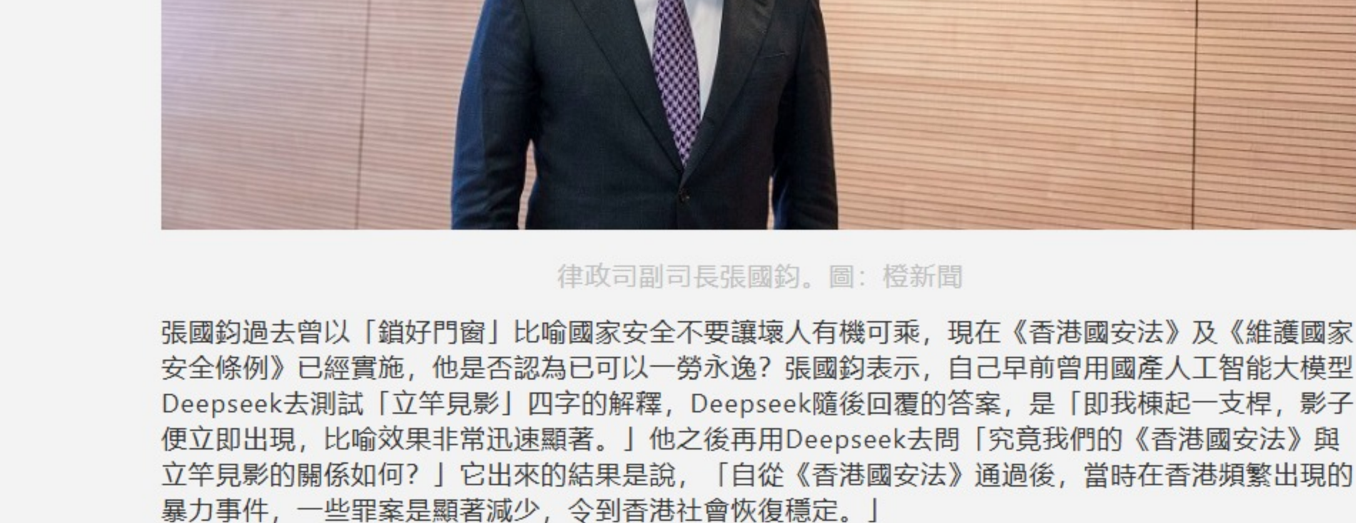
律政司副司長張國鈞。

【橙訊】 今年4月15日是第10個「全民國家安全教育日」；同時，今年亦是《香港國安法》公布實施5周年。律政司副司長張國鈞接受《橙新聞》訪問時表示，回顧《香港國安法》及《維護國家安全條例》的立法過程感觸良多，認為教育日的意義非常重大。他解釋，在《香港國安法》及維護國家安全條例出台後，效果是立竿見影，令香港回復穩定。