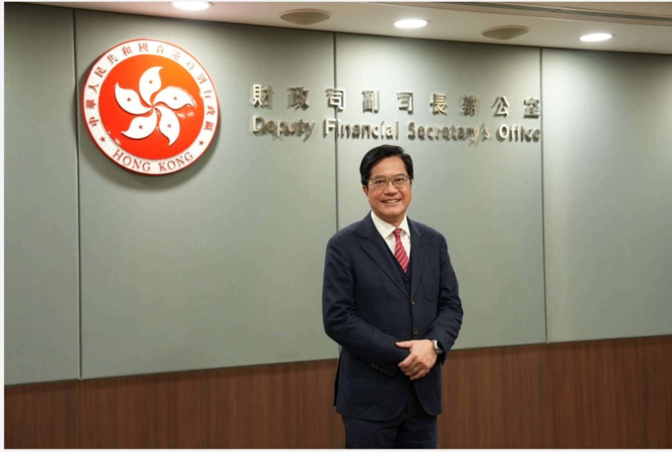
黃偉綸表示，香港在多個國際排名有所上升。

《香港國安法》出台至今已經五年，而香港完成《維護國家安全條例》工作也已經一年，築牢國家安全屏障，對於鞏固香港的國際金融中心地位有甚麼重要性？財政司副司長黃偉綸接受《橙新聞》採訪表示，《香港國安法》和《維護國家安全條例》出台之後，對香港在經濟上、金融上的安全提供了非常重大的保障，這沒有後顧之憂，香港才能全力拼經濟、謀發展。