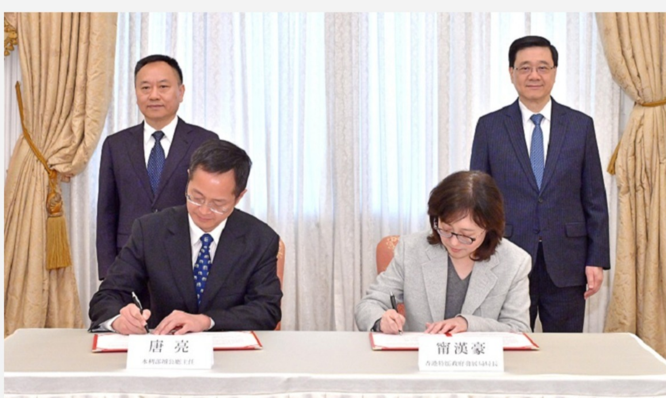
香港特別行政區政府簽署《涉水事務管理與合作的安排》。

【橙訊】行政長官李家超和水利部部長李國英今日在禮賓府會面，共同見證水利部與香港特別行政區（特區）政府簽署《涉水事務管理與合作的安排》（合作協議）。