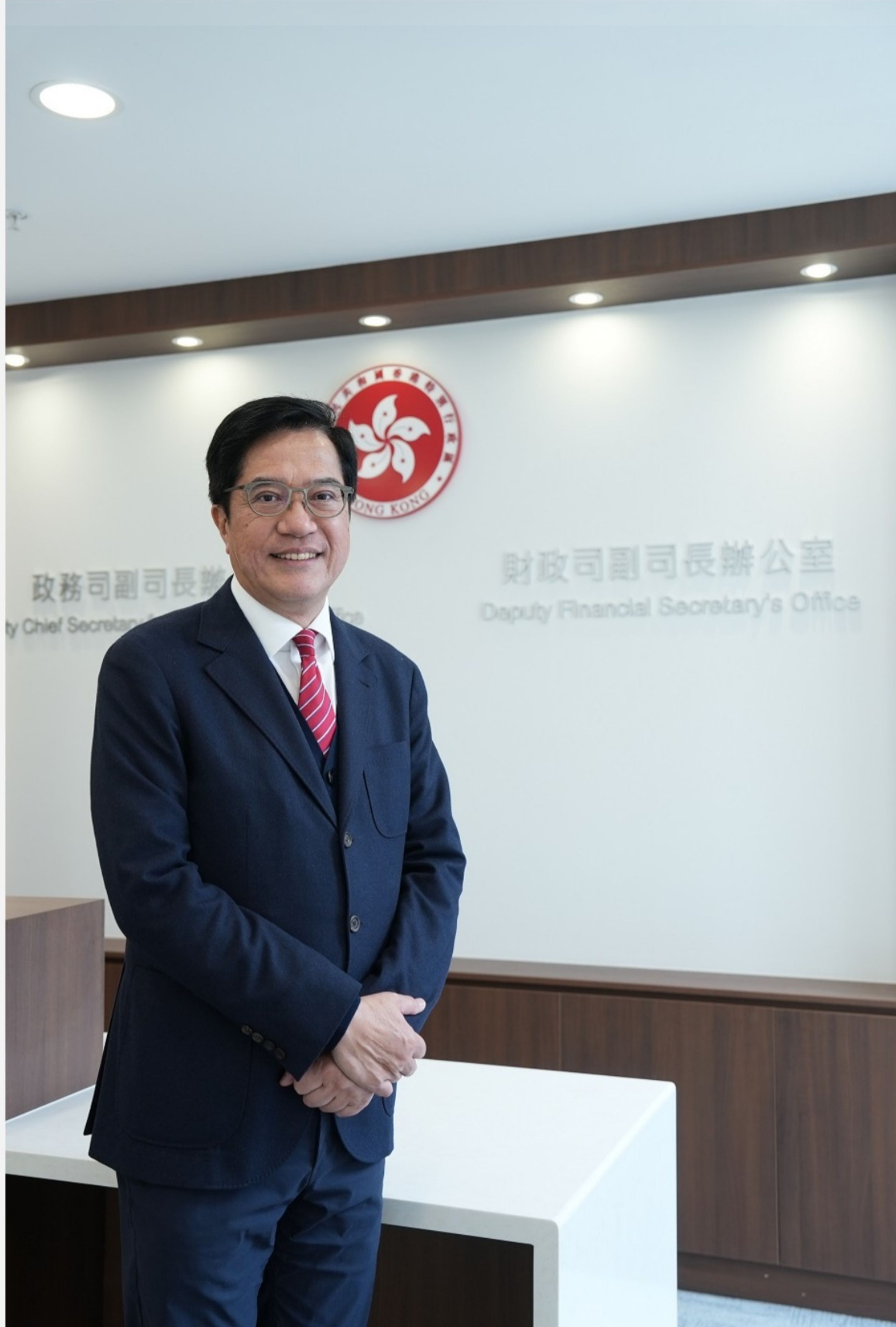
黃偉綸指，香港有龐大的外匯儲備，銀行體系的流動性充裕。

他分享了特區政府主要進行了兩方面的工作，一個是保持港元幣值穩定，第二個則是維護金融市場交易的正常運作。他說，特區政府在這兩方面表現都是相當之好，特區政府以及不同的金融監管機構都確保運作安全有序。