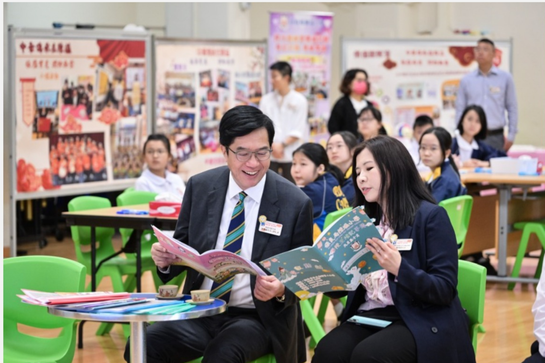
黃偉綸去年到訪了保良局陳澁小學，了解學校推行國民教育的情況。

有很多商界人士告訴黃偉綸，有一個安定的政治環境，又沒有國家安全的不確定性影響，令他們無論做生意，還是做一些長遠投資的決定，更加有信心。