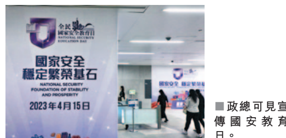
政總可見宣傳國安教育日。

紫色，代表香港特區的紫荊花，而海報除了紫色盾牌標誌外，還有刻着「國家安全」的基石，其上承載有香港標誌性建築和生活元素，寓意國家安全是香港繁榮穩定的基石。