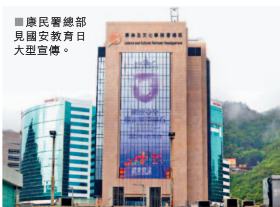
康民署總部見國安教育日大型宣傳。

下月15日即是「全民國家安全教育日」，特區政府早前已推出宣傳橫幅和海報，目前政府大樓以及市面上已經設置了大型平面宣傳橫額。