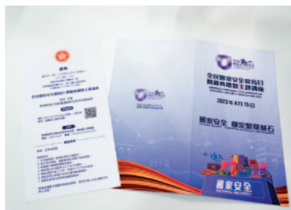
「全民國家安全教育日」請柬(左)曝光。

的背後，表達國家安全是香港穩定繁榮基石的心思。國安才能家好，維護好國家安全，社會才能夠穩定繁榮，而有國家作為強大的後盾，香港才