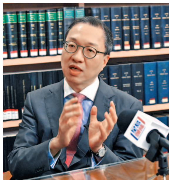
律政司司長林定國接受本報專訪。

林強調《條例草案》只適用於國安案件，但的確國家安全案件不可能有詳盡定義，但不同案件均會涉及到國家安全，違反《香港國安法》的刑事案件明顯涉及國家安全，即使是挑戰警察搜查權力或凍結資產權力的司法覆核案件，亦會涉及國家安全，只要分析案件的爭議點及證據，便近乎百分百不難分辨該案是否涉及國家安全。